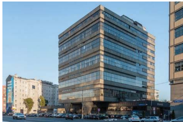
Здание ГВЦ Госплана СССР на улице Кирова (ныне Мясницкой), 45

как и её предшественница, в качестве базовых элементов использовала электронные лампы, была с ней полностью программно совместима. Она занимала площадь порядка 250 кв. м. и потребляла мощность 60 кВА. Одним из главных недостатков компьютеров «Урал-2» и «Урал-4» было их слабое системное программное обеспечение – лишь набор тестов и контрольных задач. Всего за всё время производства ЭВМ «Урал-4» (с 1962 по 1964 год) советской промышленностью было выпущено тридцать таких машин.