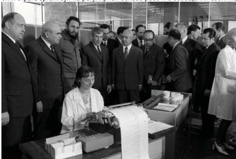
1972. В ГВЦ Госплана СССР. Фидель Кастро, Председатель Госплана СССР Н.Н.Байбаков и начальник ГВЦ Госплана СССР Н.А.Лебединский

ГВЦ Госплана СССР стал фактическим наставником деятельности своих коллег из социалистических стран, организовав на регулярной основе рабочие совещания своих коллег по СЭВу.